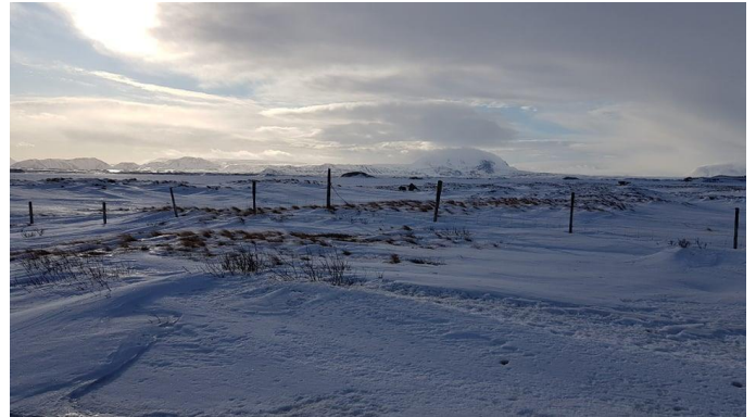
Þessi var tekin síðasta mánudagsmorgun. Öll el birtir upp um síðir.

nánari tillögur að frekari aðgerðaráætlun fyrir næsta fund sveitarstjórnar þar sem horft verði til tillagna Sambands íslenskra sveitarfélaga.