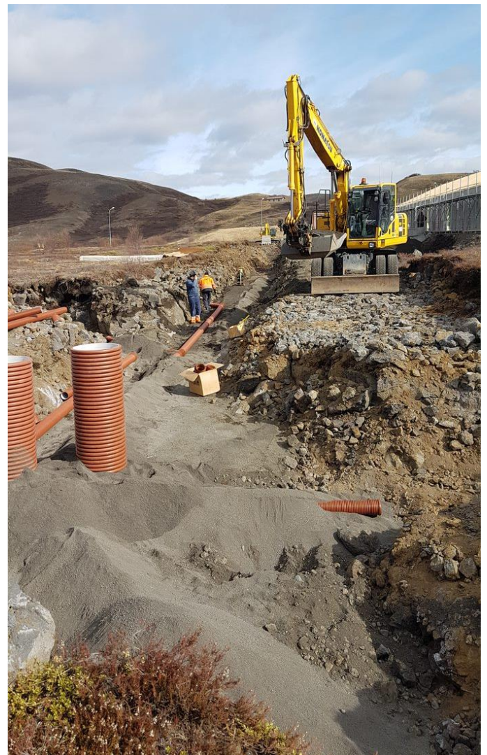
Gatnagerð í Klappahrauni.

raðhúsum og hefur sveitarfélagið fest kaup á þremur þeirra. Verð er hagstætt en þetta verkefni verður fyrirmynd að sambærilegri uppbyggingu víðar um landið að sögn verktakans. Jafnframt er unnið að gatnagerð í eystari hluta Klappahrauns en þar verður m.a. sú nýjung að allar íbúðir götunnar verða tengdar inn á nýtt fráveitukerfi sem felst í aðskilnaði svartvatns og grávatns sem er í samræmi við nýja lausn í fráveitumálum í Mývatnssveit. Er þetta fyrsta gata sinnar tegundar hér á landi þar sem þetta er gert.