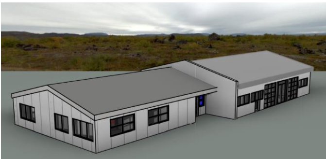
Tölvuteikning af stækkun leikskólans en leikskólinn er vinstri byggingin.