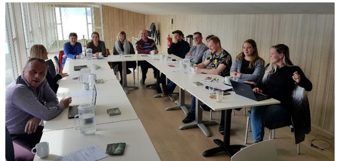
Huti þeirra sem sat aðalfund Mývatnsstofu.