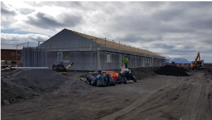
Hér rís raðhús með fjórum íbúðum á met tíma. Grunnurinn er svo klár á næsta raðhúsi.

Davíð á myvatn@ust.is eða í síma 822-4039.