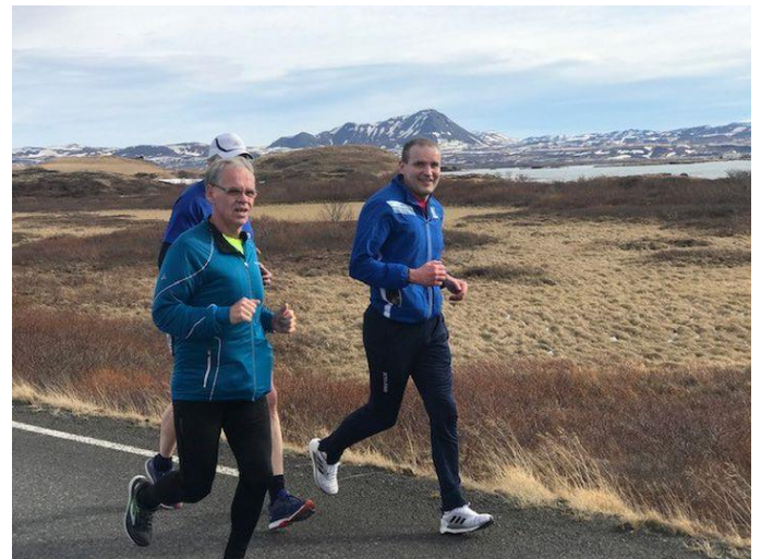
Guðni forseti í góðum félagsskap á skokkinu í Mývatnssveit.

skutustadahreppur@skutustadahreppur.is – eða með því að hringja í 464 4163 á hreppsskrifstofuna. Gefa þarf upp fjölda fólks og hvar á að taka fólk upp í rútna á leiðinni ef það fer ekki frá hreppsskrifstofu.