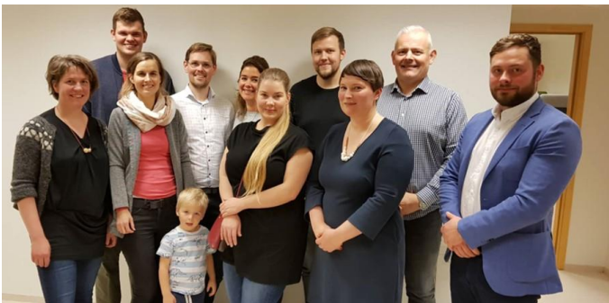
Starfsmenn á hreppsskrifstofu Skútustaðahrepps og Mikleyjar, þekkingarseturs í Mývatnssveit, ásamt oddvita og einum ungum og efnilegum. Á myndina vantar skrifstofustjóra Skútustaðahrepps.