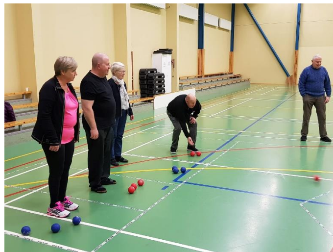
Hér er hluti hópsins að prófa boccia í fyrsta sinn.