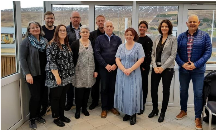
Starfsfólk á hreppsskrifstofum Þingeyjarsveitar og Skútustaðahrepps.