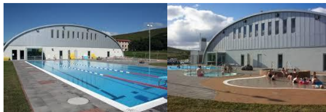
Frá sundlauginni á Laugum.

Á fundi sveitarstjórnar var lagt fram minnisblað sveitarstjóra í framhaldi af fundi 13. des. s.l. sem hann átti með forstöðumönnum og starfsfólki fjögurra ríkisstofnana sem eru með starfsemi í Mývatnssveit, þ.e. Vatnajökulspjóðgarðs, Landgræðslunnar, Minjastofnunar og Umhverfisstofnunar, um gestastofur, sýningar og/eða aðstöðu í sveitarfélaginu. Í minnisblaðinu kemur fram tillaga um að settur verður stýrihópur á laggirnar með fulltrúum viðkomandi stofnana, ásamt Ramý, til að fylgja málinu eftir. Sveitarstjórn samþykkti að setja stýrihóp á laggirnar um verkefnið og sveitarstjóri ásamt oddvita verði fulltrúar sveitarfélagsins.