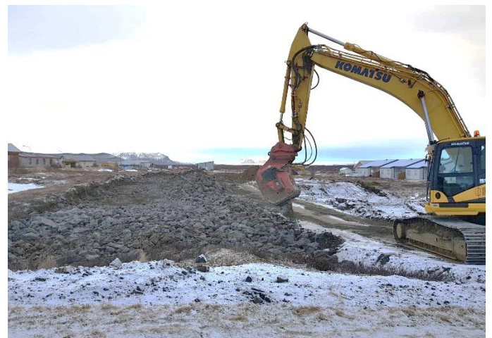
Gatnagerð hófst við austari hluta Klappahrauns í síðustu viku. Lítil snjór er í Mývatnssveit þessa dagana.

Sveitarstjórn samþykkti tillöguna á fundi sínum í gær og hún tekur því gildi fyrir þetta almanaksár. Sumarlokun leikskólans Yls næsta sumar verður því frá 1. júlí til 2. ágúst.