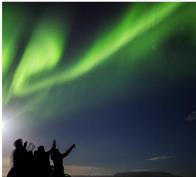
Norðurljósín hafa verið áberandi í Mývatnssveit að undanfögnu.

mælunum. Skilafrestur er til og með 15. janúar 2018. Nánari upplýsingar eru veittar á skrifstofu Skútustaðahrepps í síma 464 4163 og á heimasíðu.