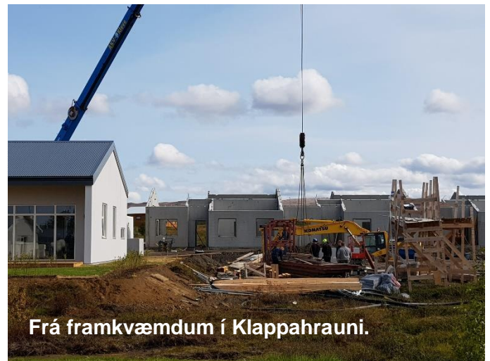
Frá framkvæmdum í Klappahrauni.

Sveitarstjórn samþykkti skólastefnuna og þakkar stýrihópnum vel unnin störf. Sveitarstjóra er jafnframt falið að kynna skólastefnuna fyrir íbúum sveitarfélagsins. Skólastefnuna er m.a. hægt að nálgast á www.skutustadahreppur.is . Hún verður jafnframt send á alla foreldra/forráðamenn í tölvupósti. Þegar er farið að vinna eftir henni í fjárhagsáætlun sveitarstjórnar fyrir næsta ár.