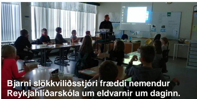
Bjarni slökkviliðsstjóri fræddi nemendur Reykjahlíðarskóla um eldvarnir um daginn.

Áfram verður boðið upp á ókeypis frístundapjónustu eftir að skólatíma lýkur hjá grunnskólanum og jafnframt upp á ókeypis ritföng næsta haust. Áfram verður boðið upp á upp á akstur í félagsstarf eldri borgara á fimmtudögum. Reykjahlíðarskóli verður tölvuvæddur, gert ráð fyrir áframhaldandi endurnýjun á húsgögnum, hljóðkerfi fyrir kennara í íþróttahúsi o.fl. Nýjar heimasíður verða gerðar fyrir Reykjahlíðarskóla og leikskólann Yl. Þá mun leikskólinn bjóða upp á leikskólaappið Karellen. Gert er ráð fyrir nýjum samningum við félag eldri borgara og Golfklúbb Mývatnssveitar. Keyptur verður aðgangsstýribúnaður í íþróttamiðstöðina til að hafa sólarhringsaðgang að líkamsræktar- aðstöðu.