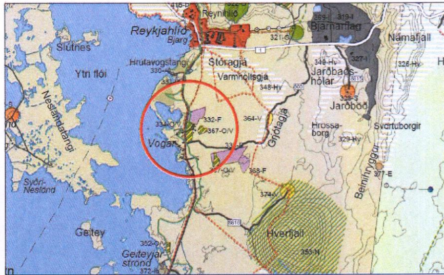
Aðalskipulag Fjallabyggðar 2008-2028 m.s.br.