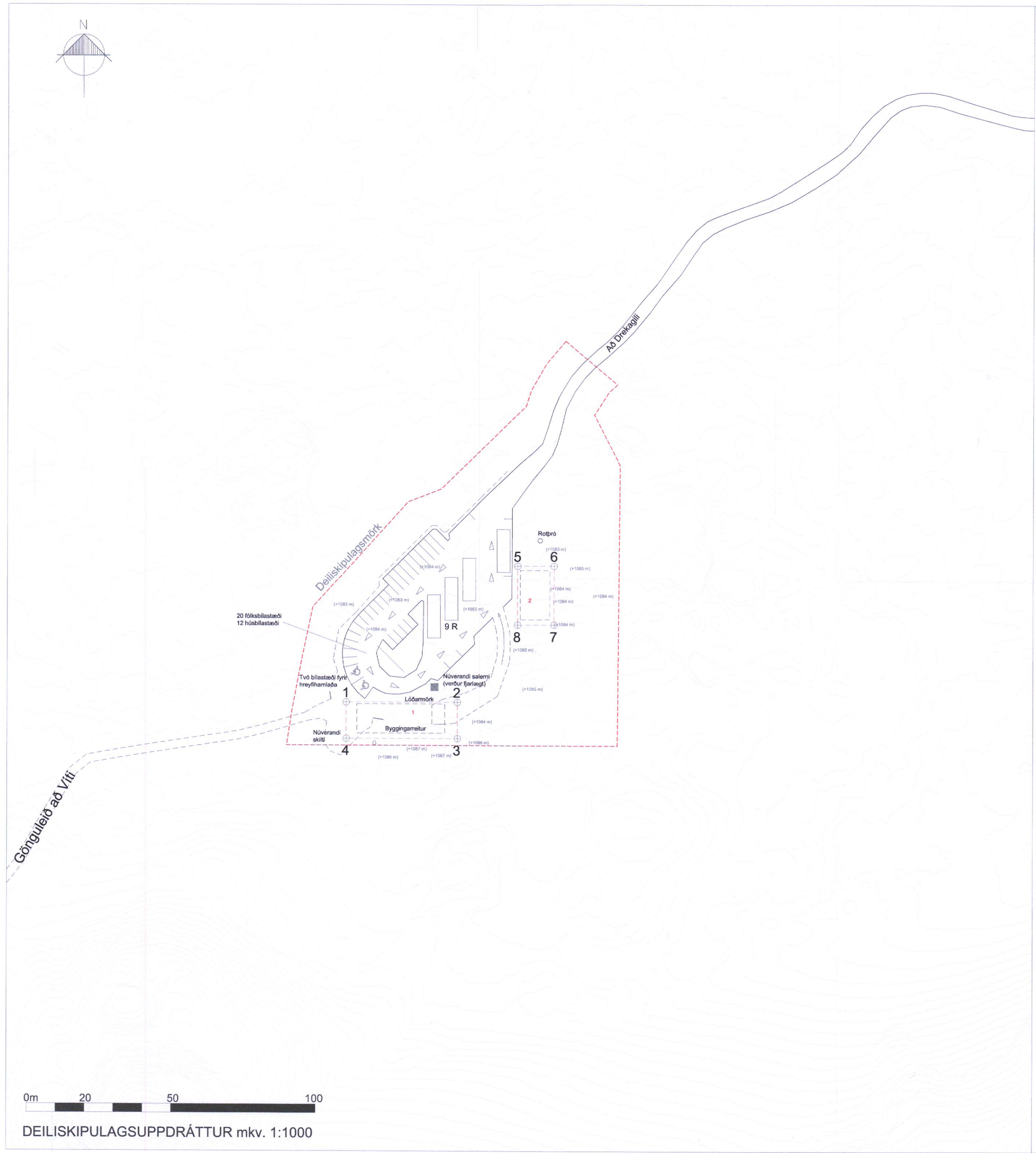
DEILISKIPULAGSUPPDRÁTTUR mkv. 1:1000